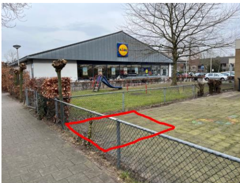
Locatie te plaatsen trafo