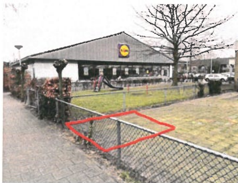
Locatie te plaatsen trafo