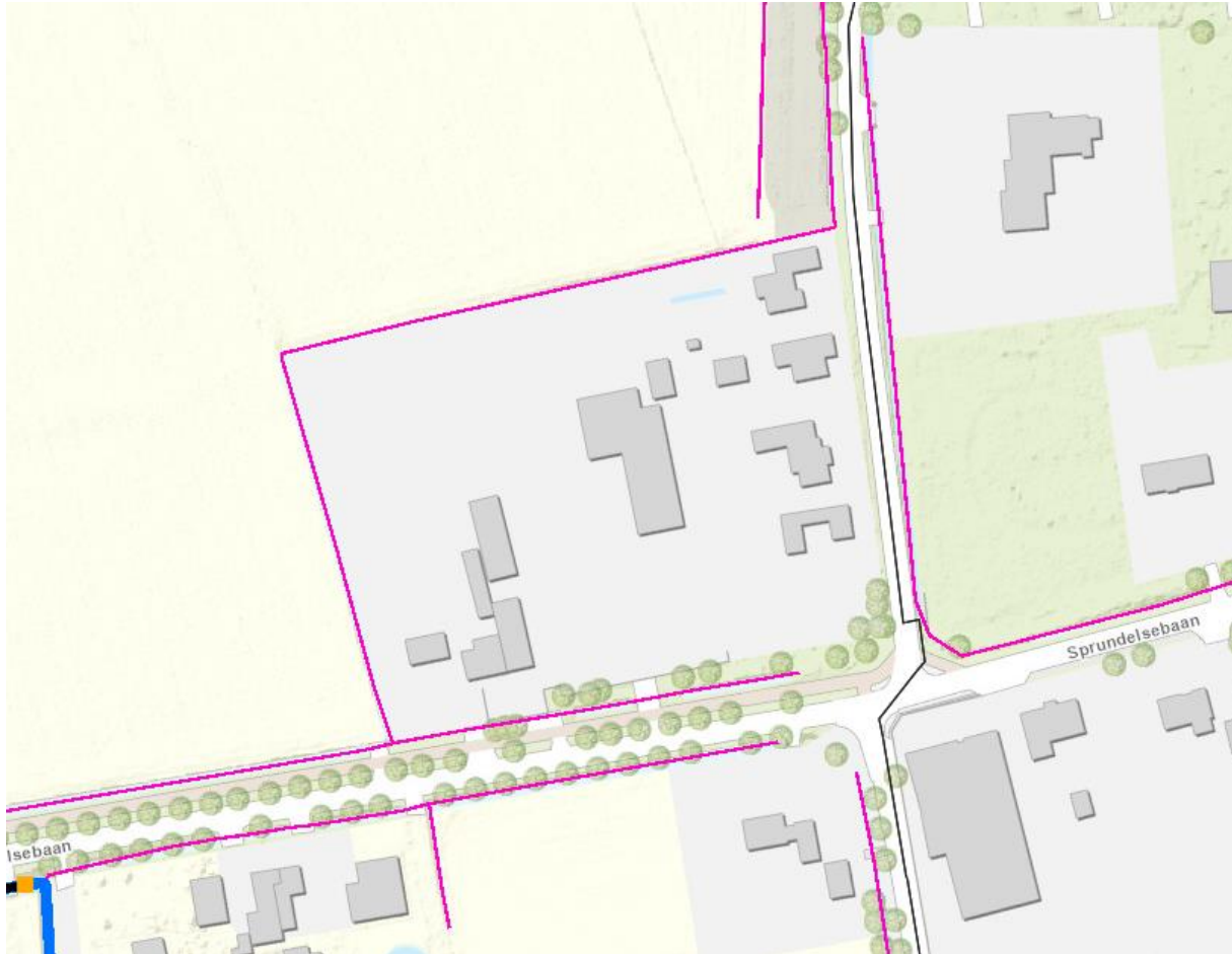
Afbeelding 4 B-waterlopen op de locatie Hilsebaan 319

Aan de aanwezige kavelsloten (B-waterlopen), die om het perceel lopen, worden geen wijzigingen aangebracht.