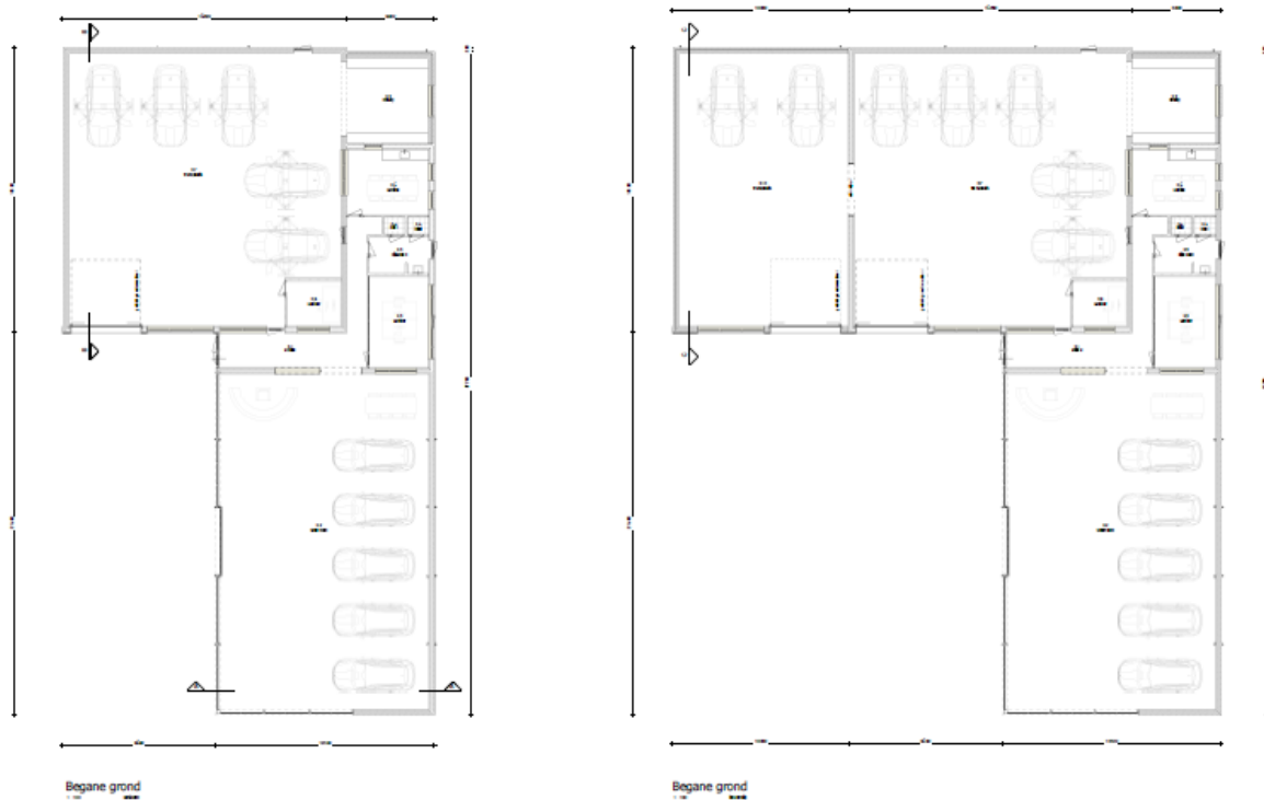
Afbeelding 1 De oude situatie (links) versus de beoogde situatie (rechts)

De initiatiefnemers hebben op dit moment een garagebedrijf aan de Hilsebaan 319. Voor de doorontwikkeling van het bedrijf hebben de initiatiefnemers de wens om een aanbouw te doen aan het bestaande bedrijfsgebouw. Op de plaats waar de aanbouw gewenst is, is op dit moment slechts gedeeltelijk een bouwvlak aanwezig. Om die reden is door de initiatiefnemers verzocht om het bestaande bouwvlak van vorm te veranderen op basis van artikel 5.6.1 van het bestemmingsplan 'Buitengebied', zodat de uitbreiding volledig binnen het bouwvlak kan plaatsvinden.