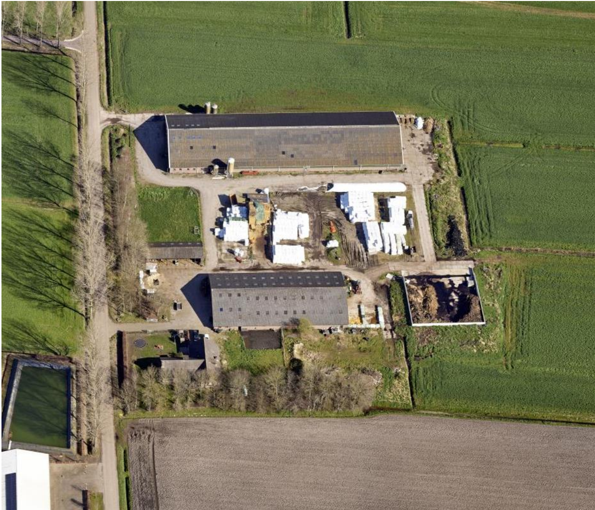
Afbeelding 1 Luchtfoto Haansberg 146

De initiatiefnemers hebben op dit moment een geitenhouderij aan de Haansberg 146. Een vergunningaanvraag is ingediend om het bestaande bedrijf om te schakelen van geiten naar runderen. Met deze wijzigingsprocedure wordt op basis van artikel 38.13 de functieaanduiding 'specifieke vorm van agrarisch – geiten- en / of schapenhouderij' verwijderd. Met het verwijderen van de functieaanduiding wordt het in de toekomst niet meer mogelijk om geiten of schapen te houden op deze locatie. Dit komt ten goede van de gezondheid in de omgeving en het neemt een risico weg voor de ontwikkeling van de woningbouwontwikkeling aan de Haansberg.