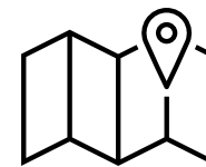
Zonekaart centrum Etten-Leur